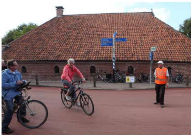
Bij een beetje evenement hoort tegenwoordig een heuse verkeersregelaar...